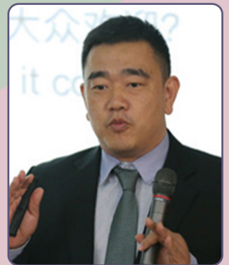
البروفيسور كو هو

الأستاذة آشا سينغ كانوار - إحدى أبرز مؤيدي التعلم من أجل التنمية المستدامة - هي رئيسة ومديرة تنفيذية لرابطة الكومنولث للتعلم عن بعد، قبل الانضمام إلى رابطة الكومنولث للتعلم، عملت الأستاذة كانوار لفترة قصيرة في المكتب الإقليمي للتعليم في إفريقيا التابع لمنظمة اليونسكو حيث جاءت بعد مسيرة مهنية متميزة في جامعة إنديرا غاندي الوطنية المفتوحة بالهند، تتمتع الأستاذة كانوار بخبرة تمتد لما يزيد عن 35 عاماً في مجالات التدريس والبحث والإدارة.